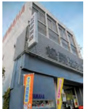
レッスン会場の各務原センター