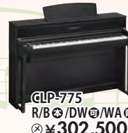
CLP-775 R/B/DW/WA 税込 ¥302,500