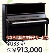
今なら高低自在椅子サービス YU33 税込 ¥913,000