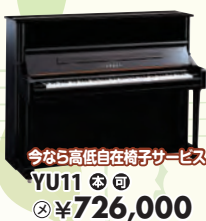
今なら高低自在椅子サービス YU11 税込 ¥726,000