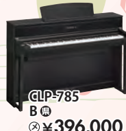
CLP-785 B 税込 ¥396,000