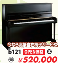
今なら高低自在椅子サービス b121 OPEN価格 税込 ¥520,000