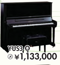
YUS3 税込 ¥1,133,000