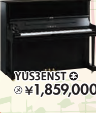
YUS3ENST 税込 ¥1,859,000