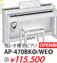
カシオ電子ピアノ AP-470BK/WE 税込 ¥115,500