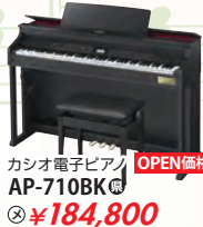
カシオ電子ピアノ AP-710BK 税込 ¥184,800