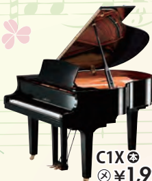
C1X 税込 ¥1,925,000

ベストセラーCXシリーズの代表モデルを本店にて展示。実際に弾いて、聴いてその違いをお確かめください。