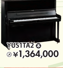
YU1TA2 税込 ¥1,364,000