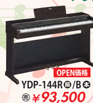
カシオ電子ピアノ YDP-144R/B 税込 ¥93,500