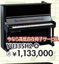
今なら高低自在椅子サービス YU33SH2 税込 ¥1,133,000

サイレント、自動演奏など、デジタルとアコースティックの融合。ヤマハしかできない、革新的ハイブリッド機能をぜひご確認ください。