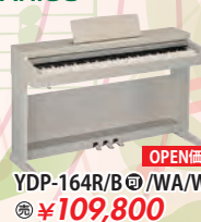
カシオ電子ピアノ YDP-164R/B/WA/WH 税込 ¥109,800