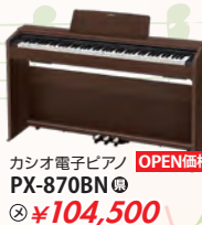
カシオ電子ピアノ PX-870BN 税込 ¥104,500