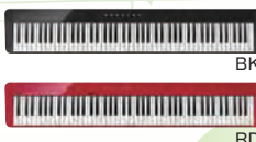
カシオ電子ピアノ PX-S1000 OPEN価格 RD/BK/WE 税込 ¥60,500