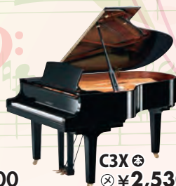
C3X 税込 ¥2,530,000