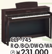
CLP-745 R/B/DW/WA 税込 ¥231,000