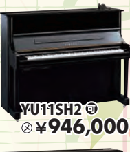
YU11SH2 税込 ¥946,000