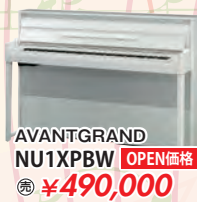
AVANTGRAND NU1XPBW OPEN価格 税込 ¥490,000