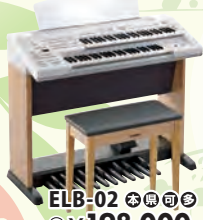
ELB-02 税込 ¥198,000

音楽教室入門モデルから、上級モデル、カジュアルモデルまで。幅広いジャンル、レベルに対応したエレクトーンはお子様から大人の方までどなたでも楽しめる楽器です。