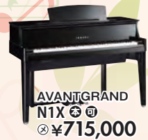
AVANTGRAND N1X 税込 ¥715,000