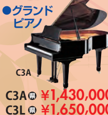
C3A C3A ¥1,430,000 C3L ¥1,650,000