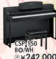
CSP-150 B/WH 税込 ¥242,000