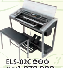
ELS-02C 税込 ¥1,078,000