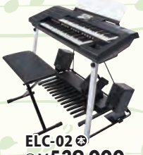
ELC-02 税込 ¥539,000