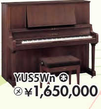
YUS5Wn 税込 ¥1,650,000