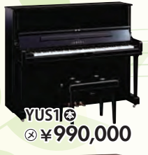
YUS1 税込 ¥990,000