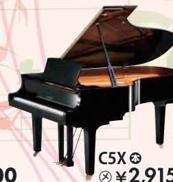
C5X 税込 ¥2,915,000