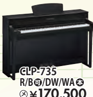
CLP-735 R/B/DW/WA 税込 ¥170,500