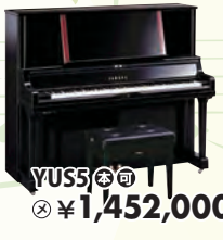
YUS5 税込 ¥1,452,000