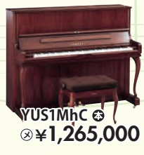
YUS1MhC 税込 ¥1,265,000