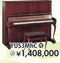
YUS3MhC 税込 ¥1,408,000