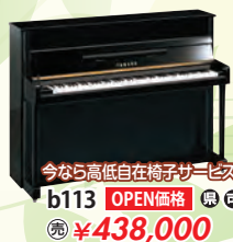
今なら高低自在椅子サービス b113 OPEN価格 税込 ¥438,000

伝統のアコースティックピアノ。基本モデルから上級モデル、木目仕上げまで。国内No.1メーカーのヤマハは正規特約店の当店で。